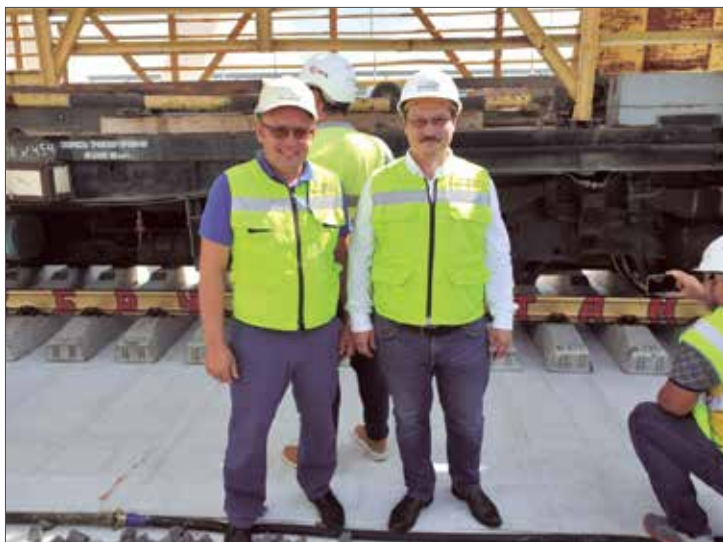
Есть «ЗОЛОТОЙ СТЫК»! 07:00 18.07.2019